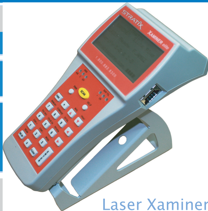
Laser Xaminer Elite IS +