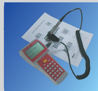
エグザマイナー Elite Wand only